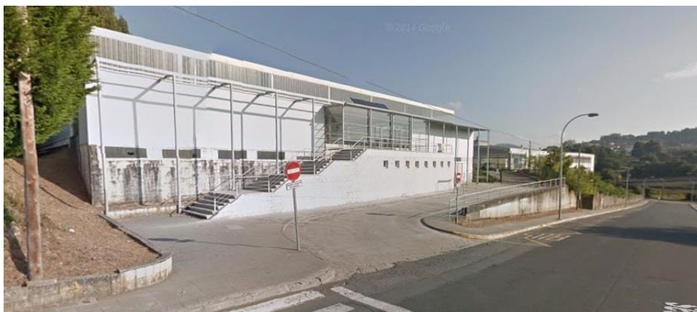
Imaxe 3. Pavillón Municipal de Deportes de Miño, lugar de saída e meta das probas

Os circuitos discorren case na súa totalidade por camiños e sendas naturais do concello de Miño, con saída e chegada no entorno do pavillón municipal.