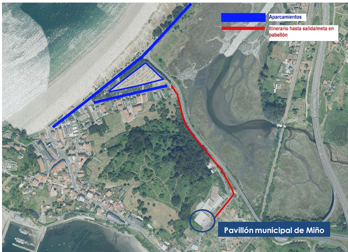
Imaxe 2. Situación do pavillón municipal e aparcadoiros na praia (Concello de Miño)

Recoméndase aparcar no entorno da praia e chegar ao pavillón a pé seguindo o itinerario recomendado: