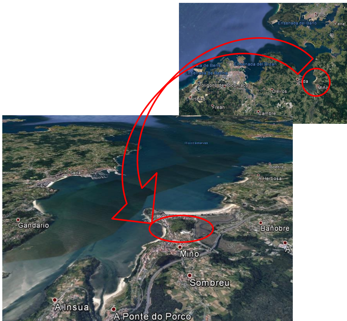
Imaxe 1. Situación do concello de Miño (Ría de Betanzos)

A proba, para todas as distancias, realizarase integramente no municipio de Miño, con saída e chegada no entorno do pavillón municipal.